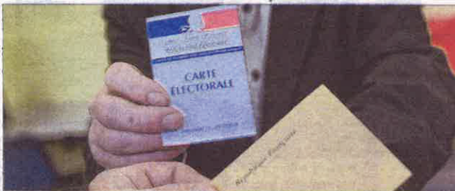
Les personnes intéressées devront se présenter à la mairie. Photo d'illustration

Lors de chaque scrutin électoral, la ville de Saint-Claude propose, à destination des personnes qui ne pourront se rendre par leurs propres moyens à leur bureau de vote, un service de transport à la demande sur réservation. Ce service gratuit fonctionnera pour les élections régionales, les dimanches 6 et 13 décembre de 8h30 à 11h30. Les personnes intéressées devront au préalable se faire connaître à la direction générale des services de la mairie de Saint-Claude, ou auprès du centre communal d'action sociale, impérativement avant les vendredis 4 et 11 décembre à 12 heures.